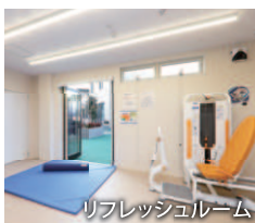
リフレッシュルーム