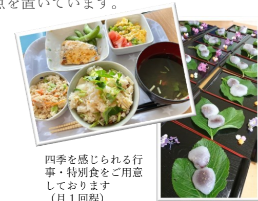
四季を感じられる行事・特別食をご用意しております（月1回程）