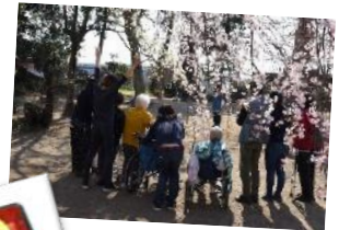
四季を感じられる行事・特別食をご用意しております (月1回程)